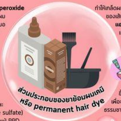
ส่วนประกอบของยาย้อมผมเดิม หรือ permanent hair dye

ขึ้นอยู่กับแบรนด์ต่างๆ จะเพิ่มเข้มนเข้าไป เพื่อจุดประสงค์การขาย เช่น สารสกัดจากธรรมชาติต่างๆ น้ำหอม และสารกันเสีย